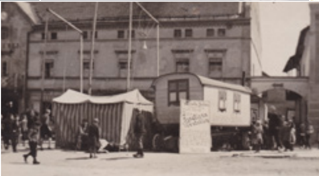
▲ Eine der häufiger in Waldkirchen gastierenden Variété-Schauen am Marktplatz, ebenfalls um 1930. (LB)