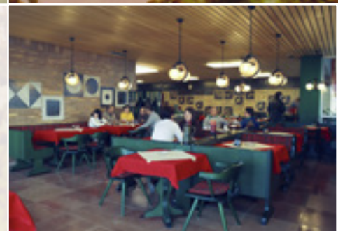
◀▶▶ Das Hallenbad Waldkirchen aus dem Jahre 1974 – von links sieht man das Schwimmerbecken, das Mediteraneum und das Restaurant. (FH)