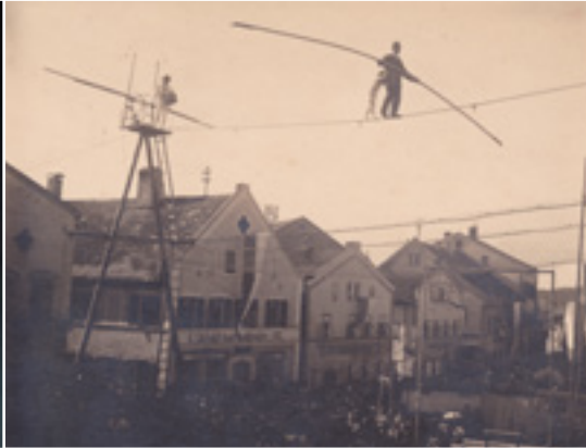
▼ Die Seiltänzer am Marktplatz 1924. (SW)