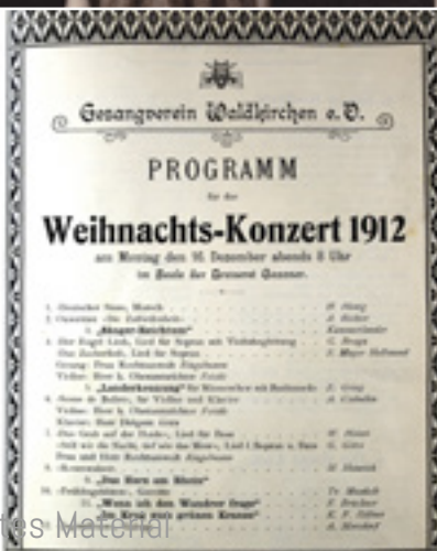
◀ Programm des Weihnachtskonzertes von 1912. (SW)