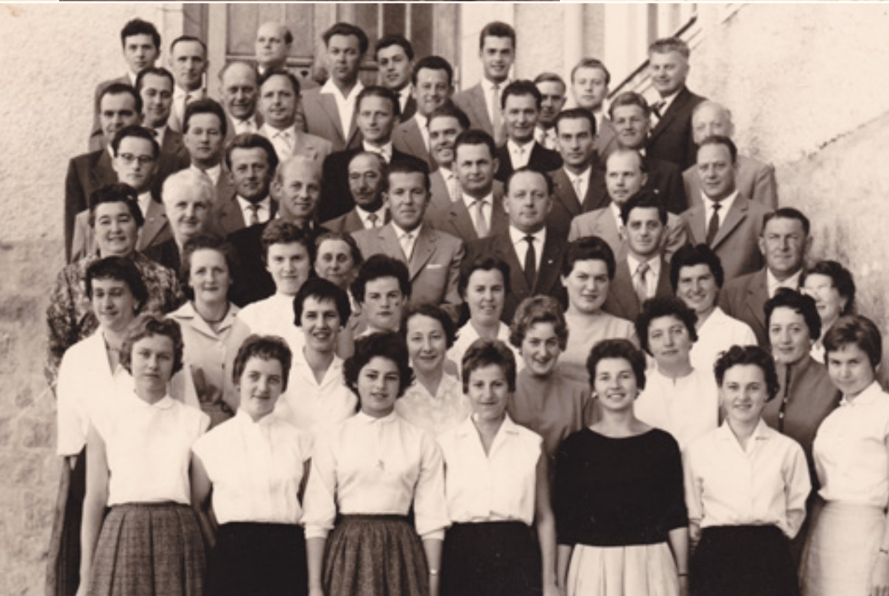
▲ Die Mitglieder der Chor- und Orchestervereinigung im Jubiläumsjahr 1958. (LB)

Handwritten text in cursive script, likely a letter or document, partially visible on the right side of the page.