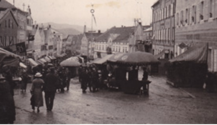
◀ Der Jahrmarkt auf dem Marktplatz von Waldkirchen um 1930. (LB)